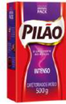
Café Vácuo Intenso Pilão 500g