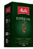
Café Torrado e Moído Especial Melitta Caixa 500g