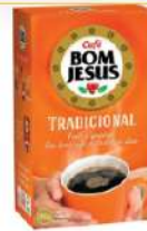
Café Torrado e Moído Tradicional Bom Jesus Caixa 500g